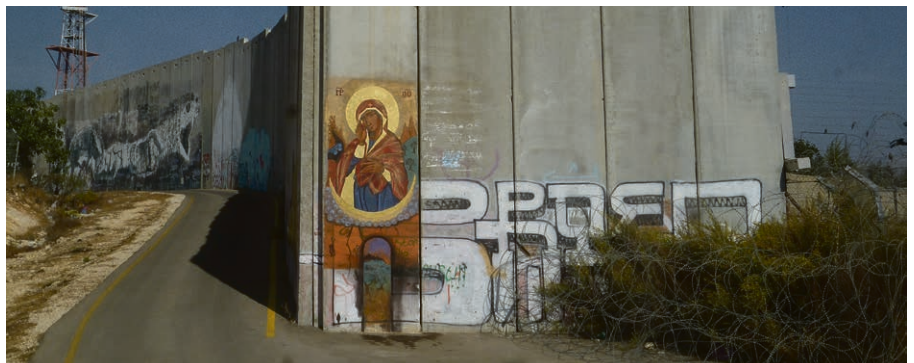
Au pied du mur de séparation.