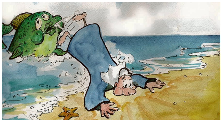
Jonas : un étonnant retour à la vie !