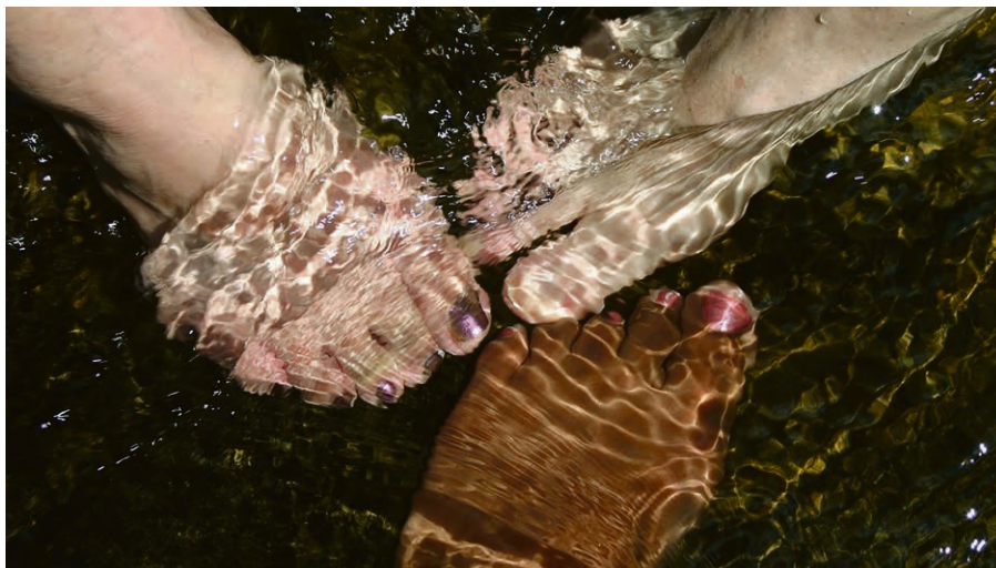
Füsse im Wasser.

Mittwoch, 23. April, 10h , Treffpunkt erfragen bei Regine Becker, 021 331 58 76.