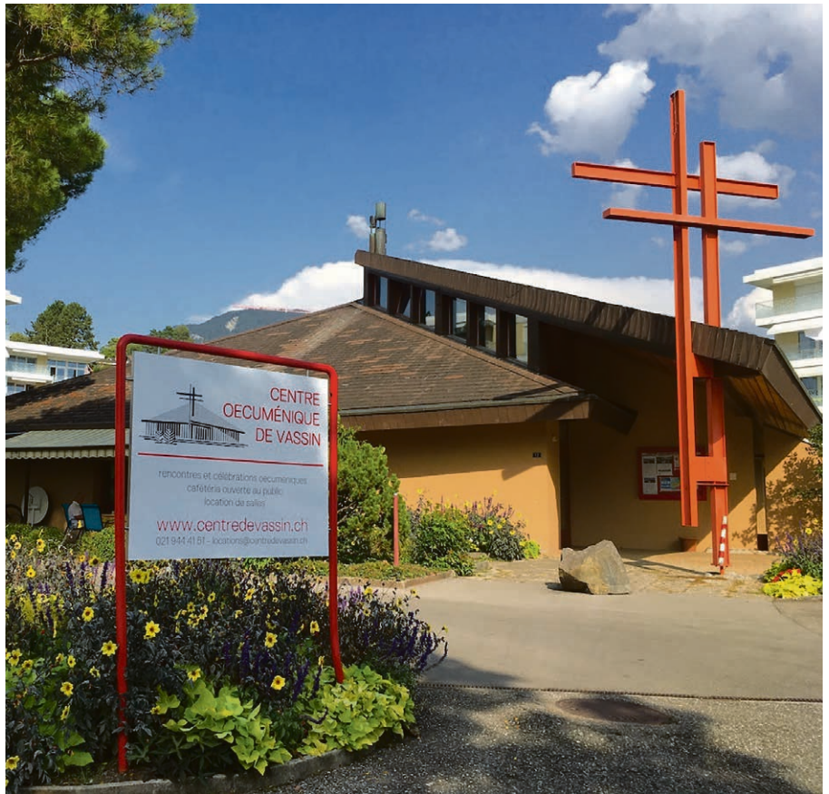
Le Centre œcuménique de Vassin.