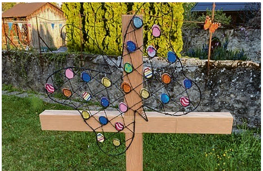
Le jardin de Pâques témoigne de la vie plus forte que la mort!

Et si vous avez besoin d'un service, envoyez un courrier à solidaire.corsier@gmail.com et nous vous mettrons en contact avec une personne disponible.