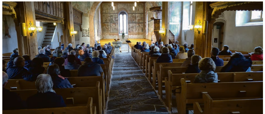
Culte commun à Saanen le 16 mars dernier.