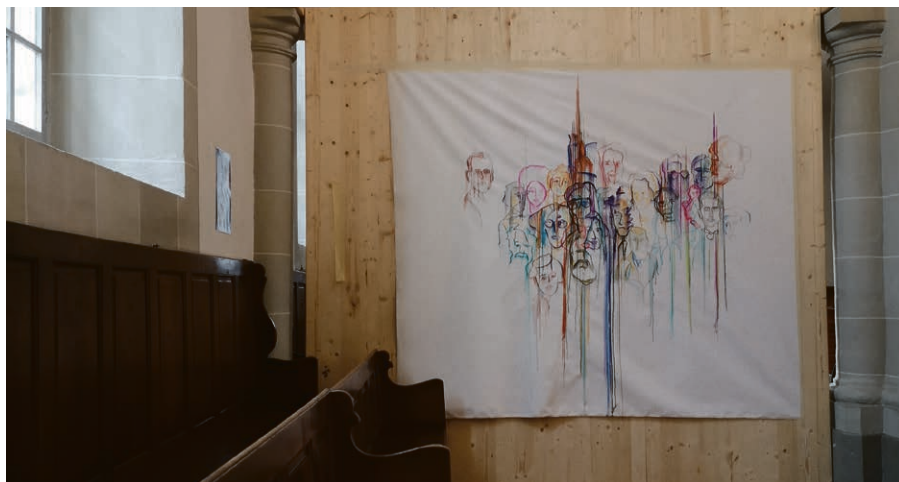
Exposition « En mémoire de... » Sainte-Claire.

Pour la petite brocante, merci d'apporter des objets en bon état vendredi 9 mai, dès 14h, ou de téléphoner au 079 675 98 42. Un don est possible sur: IBAN CH40 0900 0000 2800 0087 1, mention Terre nouvelle.