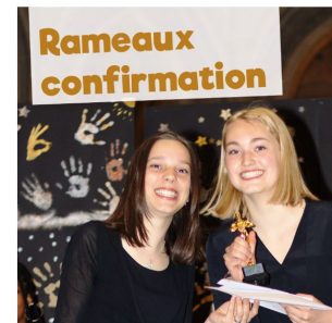
Fêter les Rameaux, confirmer, recevoir une bénédiction ou vivre le baptême: ou comment marquer la fin d'un parcours enrichissant!