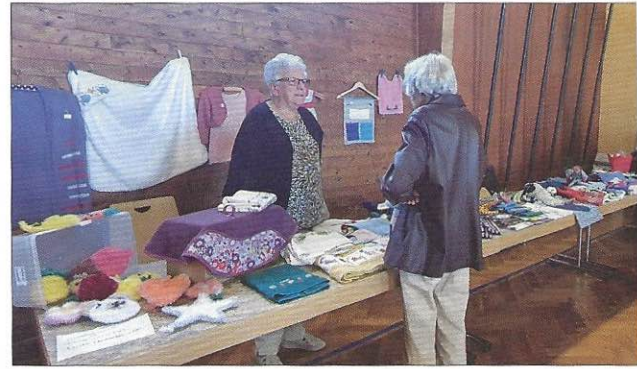
Les ouvrages des « Dames de la couture ».