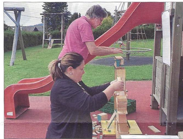
Des jeux de concentration et d'habileté ont mis à ruer participants.