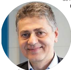
François Dérnange © DR