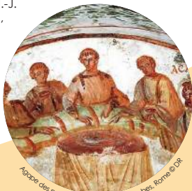
Agape des premiers chrétiens, Catacombes, Rome