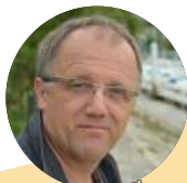
E. Cu villier © DR.

Organisation : en collaboration avec le Centre œcuménique Pré-Fontaine à Crissier