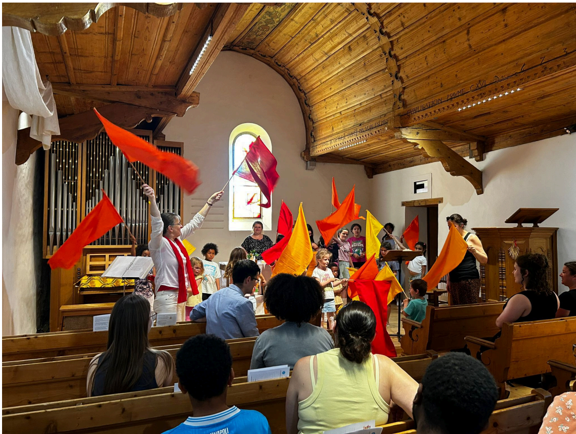
Célébration du dimanche de la Pentecôte avec les familleS à Leysin.