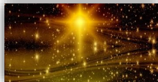
TABLEAU DES DONNÉS ET OFFRANDES

Ce n'est pas un mystère : Dieu est vulnérable parce qu'il est don et amour.