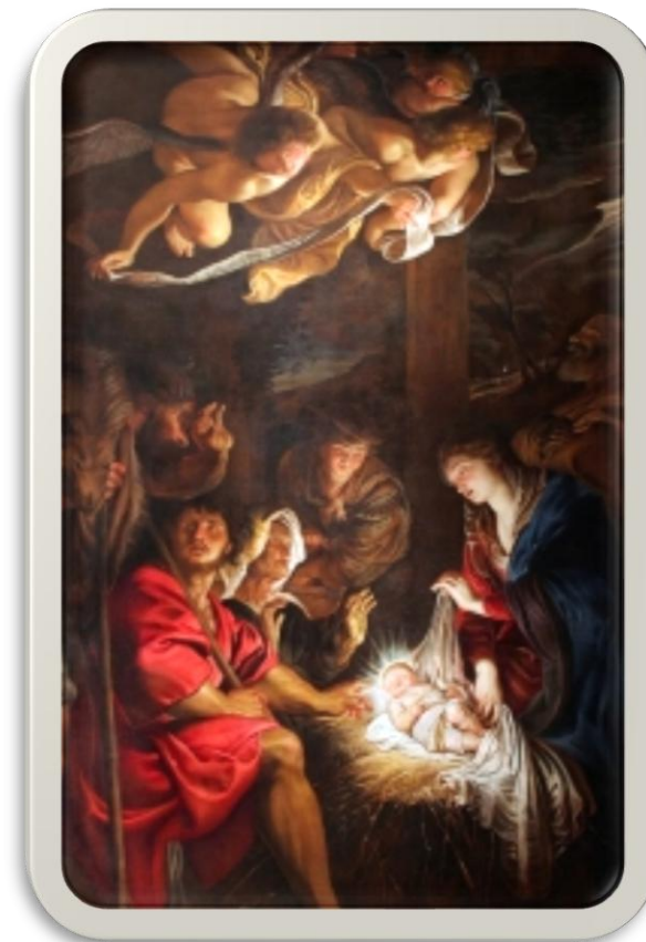
Adoration des Bergers, Peter R. Rubens 1608

Marc 10, 13-16 : « Laissez les enfants venir à moi, ne les en empêchez pas, car le royaume de Dieu est à ceux qui leur ressemblent »