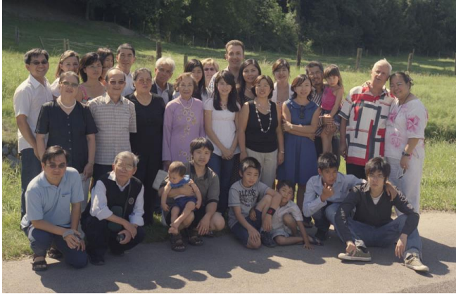
A Chavornay, été 2008