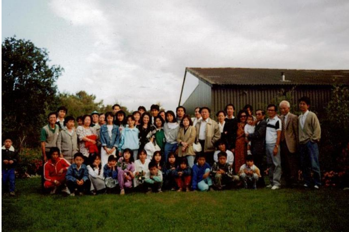
Camp en Hollande (en 1988)

De manière générale, le développement de notre communauté s'est produit dans les années huitante. Il y avait une progression constante et une expansion géographique non négligeable : plusieurs lieux de culte en Suisse, au Sud de l'Allemagne, et même en Hollande.