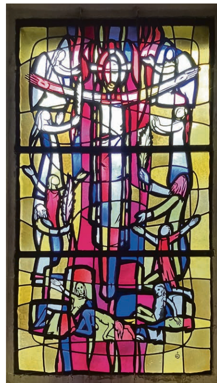
Vitrail dans la sacristie de l'église paroissiale de Payerne. © JCP