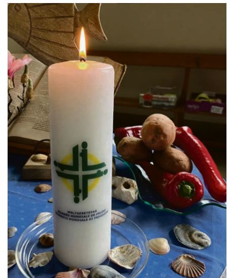
A l'occasion de la Journée mondiale de prière, une célébration aux couleurs de l'océan...