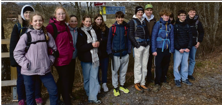
En route avec les jeunes de 11 e année, de Moudon à la cathédrale de Lausanne!