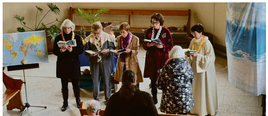
Souvenir de la Journée mondiale de prière.