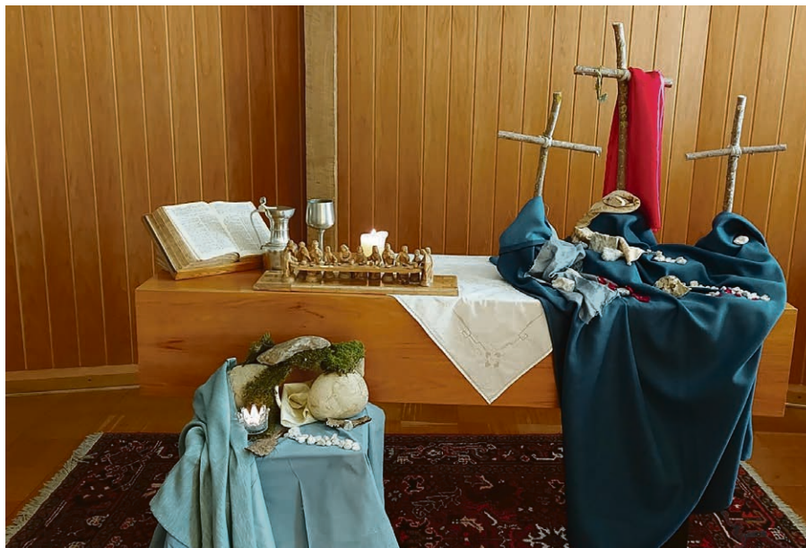
Einladung zum Osterfeier.

Kennst du das Gefühl, in eine Situation zu geraten, die du dir nicht ausgesucht hast? Plötzlich liegt eine Last auf deinen Schultern, die du tragen musst. Es kann eine schwierige Entscheidung sein, eine Enttäuschung, die du erlebst, oder eine Krankheit, die dein Leben verändert. Manchmal werden wir unerwartet mit Herausforderungen konfrontiert, die wir nicht vorhersehen konnten. Wir sind in der Passionszeit. Jesus, der ohne Schuld war, wurde verhört, verurteilt, gezeißelt und schliesslich gezwungen, das schwere Kreuz zu tragen. Die Last war so schwer,