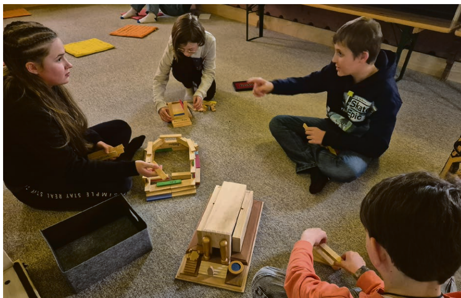
Le temple de Jérusalem en Kapla, joli dé que se sont donné les jeunes.

Mercredi 14 mai, à 20h , à Ropraz. Une heure de musique pour se faire du bien, avec Rolf Hausammann à l'orgue.