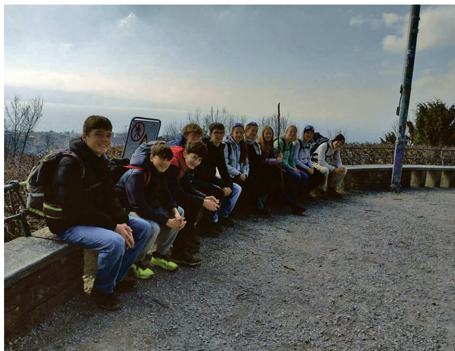
Avant la confirmation, une pause bien méritée pour les jeunes du groupe KT11 en route!

Samedi 1 er et dimanche 2 mars, le groupe « En route! », réunissant les jeunes de 11 e année inscrits au catéchisme, a parcouru les quelque 34 kilomètres reliant Moudon et Lausanne. Ce beau week-end leur a permis de resserrer leurs liens dans cette dernière ligne droite avant la confirmation. Sur le chemin, ils ont eu le plaisir de faire une halte et d'être accueillis dans le refuge El Jire de Montpreveyres, d'écouter le témoignage de deux personnes ayant vécu le chemin de Compostelle et de découvrir, grâce à une visite guidée, la cathédrale de Lausanne. Lire aussi en page 29.