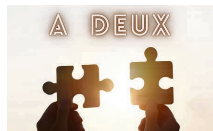
Groupe A Deux.

Apportons nos nouveaux confirmands à Dieu, ainsi que tous les enfants et les jeunes de nos paroisses.