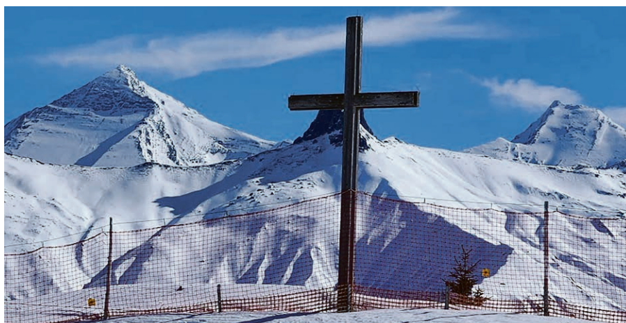
Ja Jesus lebt.

dass er unter ihr zusammenbrach. Simon von Kyrene kommt des Weges. Er war auf dem Feld. Ein Soldat zwingt ihn, das Kreuz zu tragen. Simon war nicht in Jerusalem, er war nicht dabei, als Jesus verhört wurde, er war nicht dabei, als Jesus verurteilt wurde, er hat nicht gerufen „Kreuzige ihn!“. Und doch wurde er gezwungen, das Kreuz zu tragen.