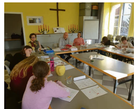
Du catéchisme revisité © Matthias Wirz

Véronique Monnard du lundi 21 au vendredi 25 avril .