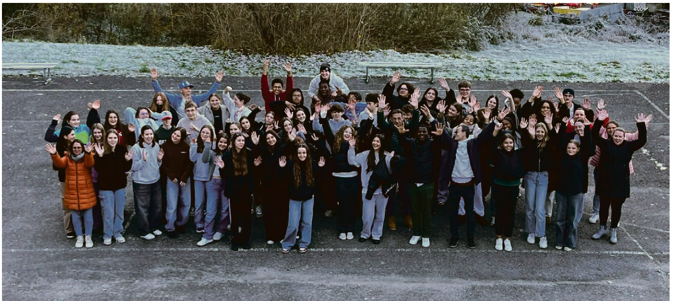
Souvenir du camp Alpha Jeunes!