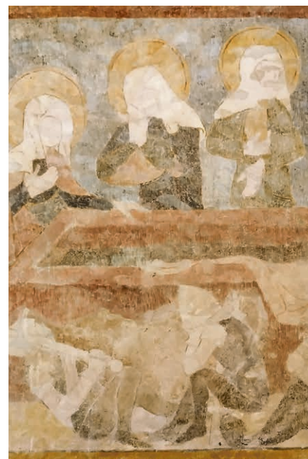
Fresque de l'église de Ressudens, scène de la résurrection. © Nicolas Monnier

Le texte de « A toi la gloire » est l'œuvre d'Edmond Budry (1854-1932), un pasteur de l'Eglise évangélique libre du canton de Vaud. Ce dernier a écrit les paroles de ce cantique en 1885 puisant la consolation, après la mort de sa première épouse,