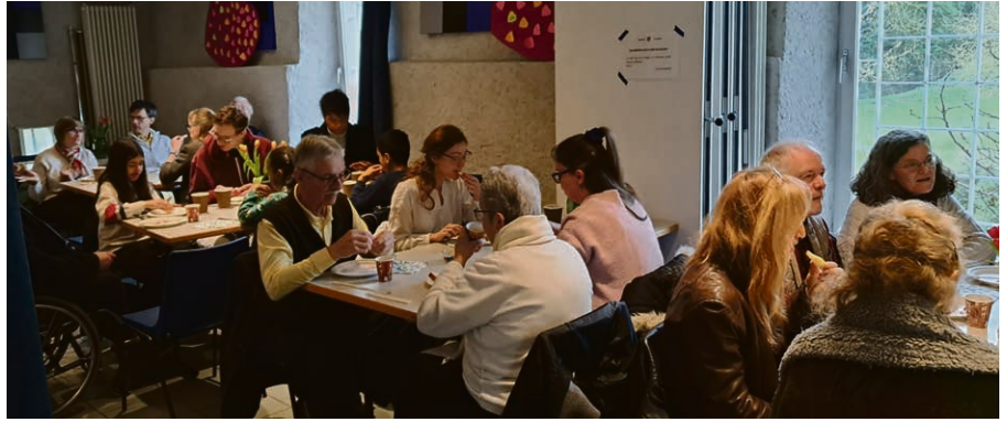
Souvenir du petit-déjeuner pascal 2024.

occasion de réjouissance, de retrouvailles et de soutien pour la paroisse. Venez nombreux ! Les jeunes du catéchisme de 9 e année participent au service et au rangement.