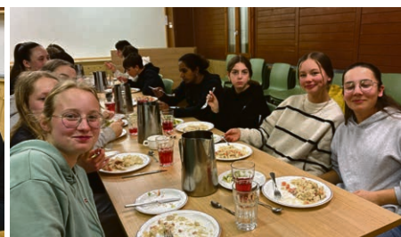
En route avec les jeunes de 11 e année, de Moudon à la cathédrale de Lausanne! © Christophe Schindelholz