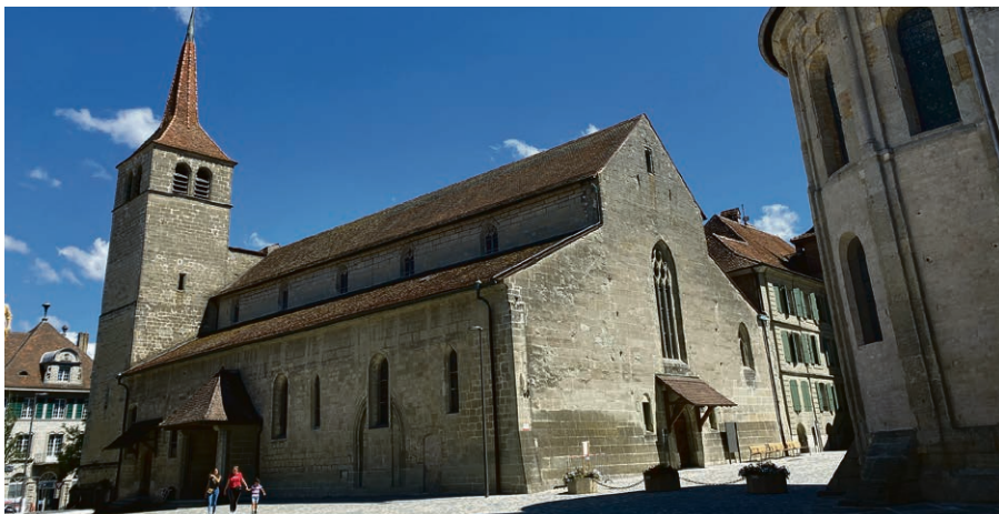
La confirmation aura lieu dans l'église de Payerne dimanche 13 avril, à 10h.

« Je me tiens à la porte et je frappe, dit Jésus, qui entend ma voix et m'ouvre la porte, j'entrerai et je me mettrai à table avec eux. » ► François Rochat