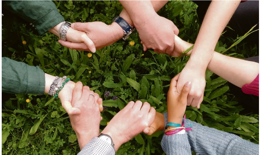
Un lien de prière .

ORON – PALÉZIEUX Rappelez-vous, nous avons déjà eu cette habitude d'allumer à jour et heure fixes dans la semaine une bougie afin de nous rallier à une prière commune – que ce soit pour la paix dans le monde, ou pour une cause plus précise. Le conseil paroissial a envie de mettre sur pied un nouvel événement périodique de ce genre afin de resserrer nos liens et de porter par la prière du plus grand nombre des sujets qui nous tiennent à cœur. Dimanche 1 er juin, dès 9h30 , au temple d'Oron : café contact, célébration puis apéritif pour lancer le projet et distribuer les bougies à toutes et tous. Les sujets de prière seront également donnés à ce moment-là. Venez nombreux !