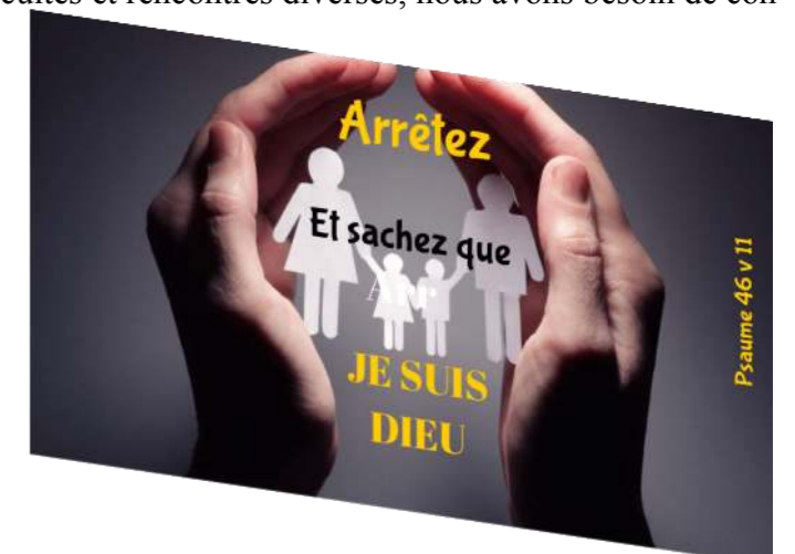
Psaume 46 v 11